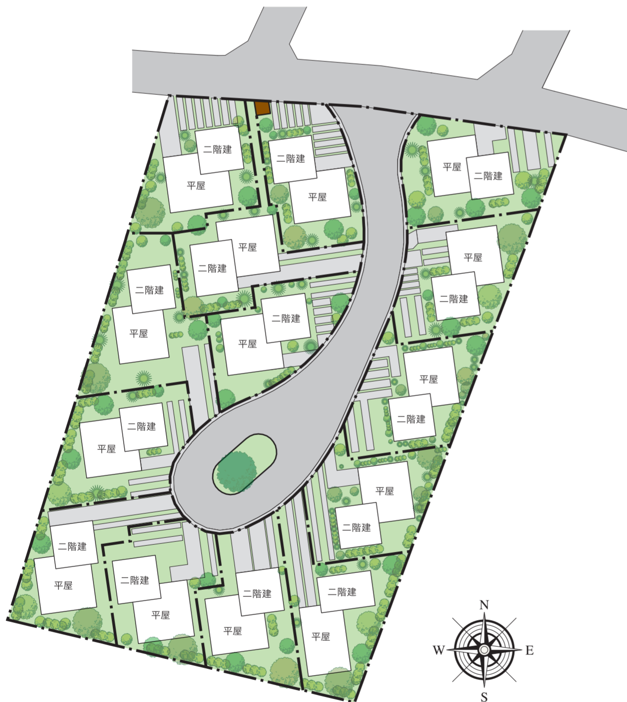
ハイブリッド平屋